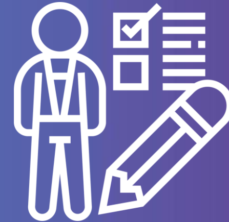
EUROPASS INFORMÁCIÓ SZOLGÁLTATÁS