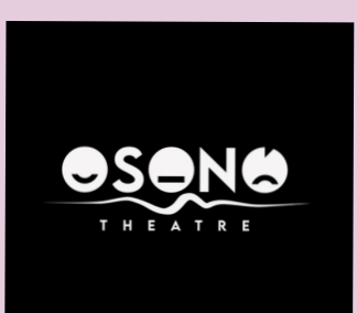
OSONÓ SZÍNHÁZMŰHELY facilitátorok

Színházi előadásokat alkotunk, műhelyfoglalkozásokat és képzéseket szervezünk fiataloknak és felnőtteknek. Oktatási és szociális projektjeinken keresztül intenzív élményt biztosítunk a résztvevőknek ahhoz, hogy önismeretük és másokkal való kapcsolataik fejlesztését elősegítsük. Olyan munkamódszert alkottunk meg, amelynek központjában a játék áll, így a résztvevő személyisége, tapasztalata és tudása úgy gyarapodik, hogy közben jól érzi magát, játszik.